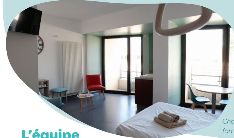
Chambre family +